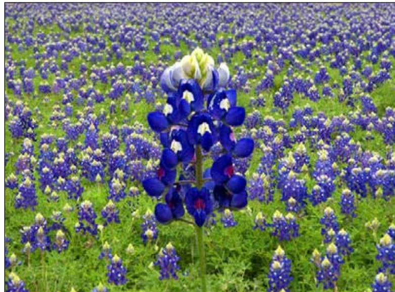
Lupinus texensis = Texas bluebonnet