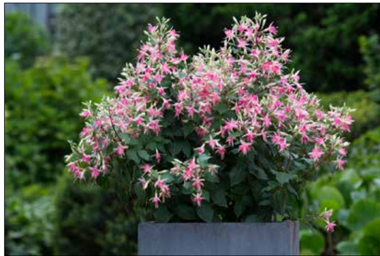
Fuchsia "Walz Jubelteen"